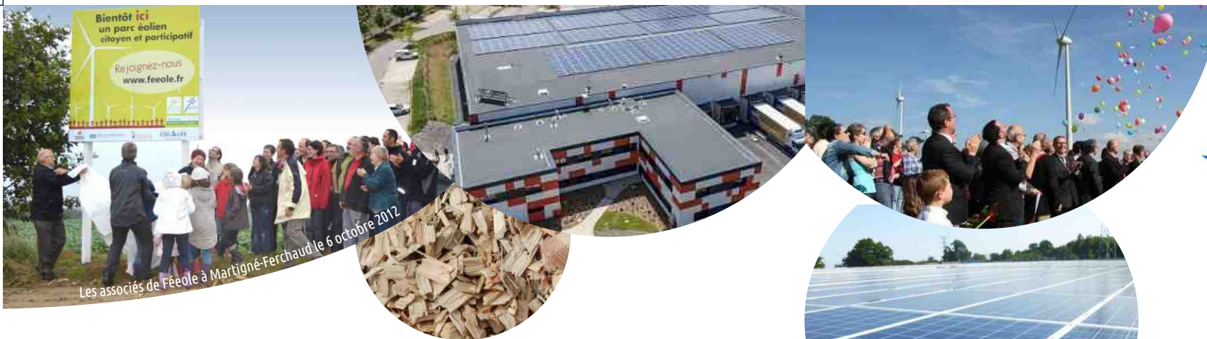
Bientôt ici un parc éolien citoyen et participatif Rejoignez-nous www.feoele.fr Les associés de Féoele à Martigné-Ferchaud le 6 octobre 2012